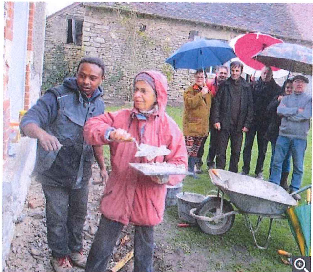
Les habitants du village ont pu s'initier aux méthodes de restauration traditionnelles.

Le groupe s'est ensuite intéressé au bâtiment d'habitation du corps de ferme, qui date de 1930, avec la question : faut-il lui donner l'apparence des constructions voisines ou conserver le style de l'époque ? « On va enlever le crépi car il y a un beau matériau dessus, on veut que ça soit soigné », répondait la propriétaire tandis que les maçons de l'entreprise Tribet, de Crevant, initiaient ceux qui le souhaitaient aux techniques traditionnelles. « Nous espérons faire naître quelque chose », concluait Yves Pétoin en soulignant que les habitants des « Bergères », très impliqués dans cette démarche patrimoniale, vont organiser une fête pour faire connaître le hameau où ils sont fiers de vivre.