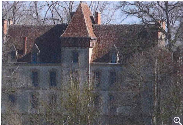
Le château de Cosnay, patrimoine emblématique du hameau.