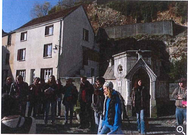
Le patrimoine local, sous tous ses aspects, reste à redécouvrir.

Surpris au premier abord, les habitants se prennent rapidement au jeu. « L'année dernière, aux Bergères, nous avons fait la démonstration du remontage d'un muret de pierre et d'enduit à pierre vue. Mais aussi un repas champêtre en commun. En associant les artisans et la Forepabe, on peut par exemple conseiller les personnes qui souhaitent réaliser des travaux sur leur propriété, pour des interventions de qualité et peu coûteuses. Ou proposer un parcours de randonnée sur le thème du patrimoine. »