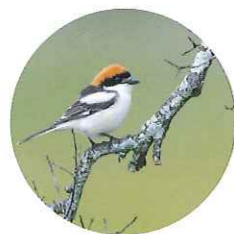
Pie-grièche à tête rousse

La survie de ce petit rongeur arboricole très discret, appelé aussi « Rat d'Or », dépend de la continuité du réseau de haies.