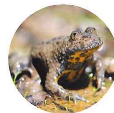
Sonneur à ventre jaune

La larve de ce gros insecte coléoptère très rare, se développe pendant plusieurs années dans le terreau des gros arbres creux (têtard, émonde).