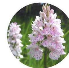
Orchis à feuilles tachetées

Petit amphibien discret malgré sa face ventrale jaune marbrée de noir. Il vit dans les prairies humides où il dépend étroitement du réseau de ruisseaux, sources et mouillères.